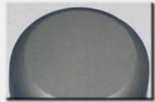
2 Leuchtstreifen, gerader Abschluss, Gravurfläche 36mm