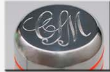
3 Leuchtstreifen, gerader Abschluss, Gravurfläche 36mm