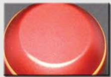
2 Leuchtstreifen, gerader Abschluss, Gravurfläche 36mm